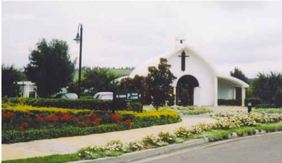
Hunter Garden' sの白い教会

オーストラリアの飲食店で仕事を得るには、いろいろな点を注意しなければならない。もしだめなら私にメールをください。アドバイスします。