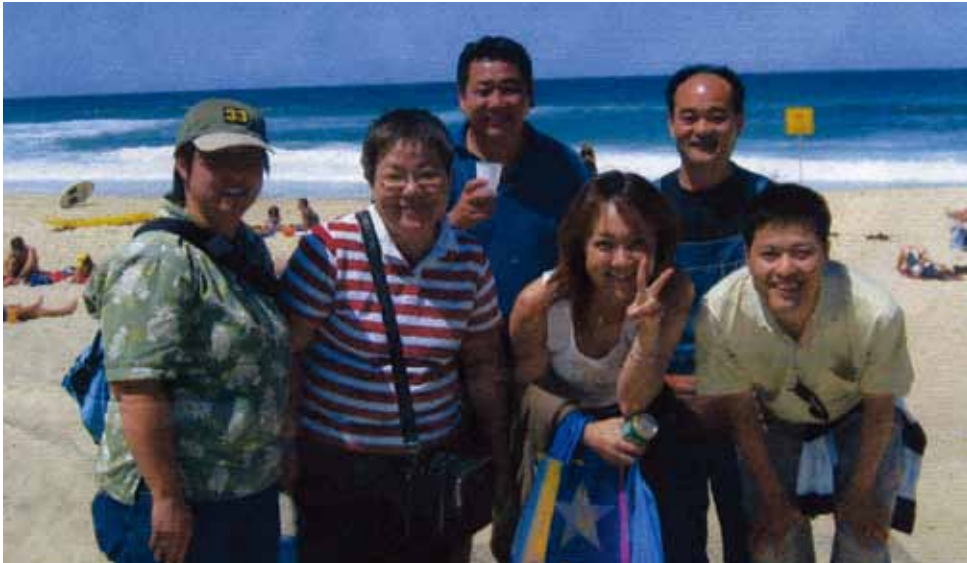
誠創業のスタッフとのBBQパーティー

いる。素晴らしいパフォーマンスだ。あのパフォーマンスをシティのチャイナタウンでやれば、1日1,000人以上のお客が来ると思う。お客の前で作る屋台ラーメン、ソバ、うどん、焼鳥、ウナギの蒲焼、みたらし団子…。ワーホリの方々、私はお金は出せませんが、人脈とアイデアは提供できます。Let's Challenge!