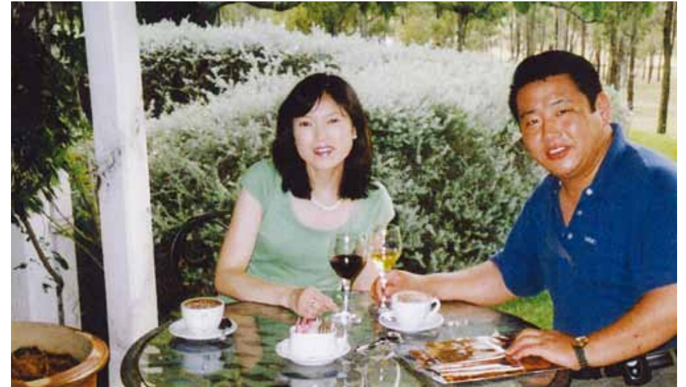
2月20日、Peppers Guest Houseにて妻の誕生日を祝う

見習い、朝はきちっと勤行し、1日1日に感謝してゆくようにする……。 そうですね、恵智子。