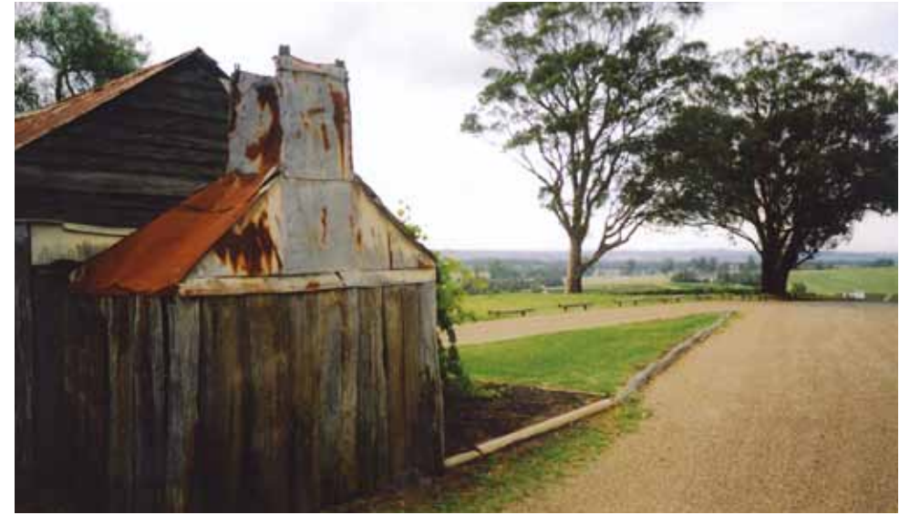
創業150年の老舗Tyrell'sワイナリー

そして近ごろ注目を集めているのが、ハンターでのウェディングである。最大300名まで収容可能な「Wyndham Estate、Tatler Vineyard」、 「Lindemans Winery」、少人数のウェディングに向いている「Peppers Convent」、 「The Sebel Kirkton Park」などがある。また、Hunter Garden'sの白い教会と後ろの山々の美しさは、2人きりで挙げる結婚式だと